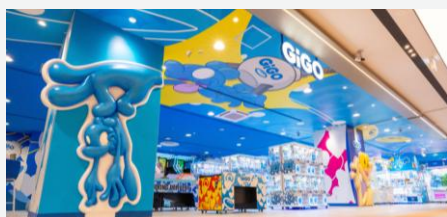
▲GiGOイオンモール津田沼South

18日、千葉県習志野市・新津田沼駅直結のビル5階に「GiGOイオンモール津田沼South」がオープン。本店舗は、Z世代から絶大な支持を集める覆面現代アーティスト「COIN PARKING DELIVERY」が、内装からゲーム機、「GiGOのたい焼き」のデザインまで手がけた、世界初の恒久的な施設です。さらにブシロードのトレーディングカードショップを併設し、アートとゲームが融合した唯一無二の空間を実現しています。アーティストックで楽しい雰囲気がオープン直後からSNSでも注目を集め、計画の約2倍のお客様が来店され、連日賑わっております。