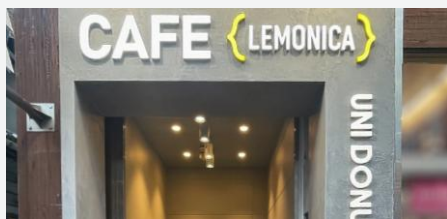
▲LEMONICA／UNI DONUTS 原宿店

15日、原宿・竹下通りに、レモネード専門店「Lemonade by LEMONICA」が手がけるカフェ「LEMONICA(レモニカ)」と、生ドーナツブランド「UNI DONUTS(ユニドーナツ)」初の複合旗艦店となる「LEMONICA／UNI DONUTS 原宿店」がオープンしました。テニスコートを想起させるポップで開放感のある店内では、レモネードをはじめ、こだわりのコーヒーや抹茶、「UNI DONUTS」の生ドーナツを提供しています。竹下通りのエネルギー溢る雰囲気と調和したフォトジェニックな空間は、若年層を中心に大きな反響を呼んでいます。