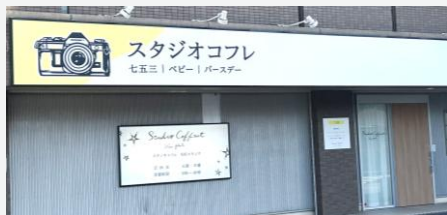
▲スタジオコフレ有松スタジオ

20日、株式会社キャラットが展開するプライベート型フォトスタジオ「スタジオコフレ」の49店舗目、愛知県内では5店舗目となる「スタジオコフレ有松スタジオ」が、名古屋市緑区にオープンしました。名古屋市全16区の中で最も人口が多い緑区への出店となります。「スタジオコフレ」は、お子様の成長の軌跡を、特別な空間でリラックスしながら撮影できるフォトスタジオです。コフレオリジナルの衣装に加え、ご家族だけで貸し切りのできるプライベート空間が支持されています。オープン後は想定約2倍となるお客様が来店され、好調なスタートを切りました。